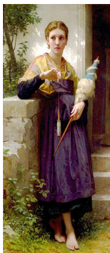
QUENOUILLE EN MAIN

Certains éléments théoriques contribuèrent à l'asservissement de la femme. Et l'Église en est responsable en grande partie à cause de la position hostile qu'elle a traditionnellement vis à vis de la sexualité. Son enseignement n'a jamais réussi à trouver de justification pour le sexe, si ce n'est son lien avec la procréation. La femme était considérée comme responsable de la chute et de la tentation permanente à la concupiscence, c'est pourquoi l'Église a pesé de tout son poids pour imposer la domination de la société par l'homme. Mais cela n'est pas tout. D'autres sociétés ont fait encore plus que la chrétienté pour écarter les femmes et les opprimer. Et l'Église a au moins offert aux femmes, jusqu'aux temps modernes, la seule alternative respectable qui soit à la servilité ; dans l'histoire de la femme religieuse on trouve des femmes instruites, des femmes spirituelles et des gestionnaires exceptionnelles. La position occupée par une minorité de femme de bonnes familles fut améliorée de façon marginale par l'idéalisation des femmes dans les codes de conduite chevaleresques des treizième et quatorzième siècles. On trouve là une notion de l'amour romantique et un droit au service, une étape vers une civilisation plus élevée. [fn1]