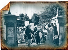
DROIT DE VOTE POUR LES FEMMES 1913

De même, le développement du chemin de fer permit à la population de se déplacer davantage. Les voyages plus faciles et plus rapides, les salaires plus avantageux dans les grandes villes encouragèrent l'exode rural vers Londres, Sheffield, Liverpool, Manchester et les communes environnantes. Des banlieues de mauvaise réputation apparurent, la pauvreté urbaine s'installa, et il ne fallut pas attendre longtemps pour que des réformateurs à tendance socialiste comprennent que les bienfaits de l'automatisme allaient être accompagnés de nombreux inconvénients. Des femmes célibataires et des mères avec leurs enfants travaillaient maintenant dans des gigantesques bâtiments en briques, actionnant et entretenant d'énormes machines dangereuses, mettant leur vie et leurs membres en danger constant.